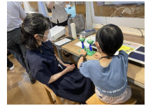
ゆらゆら3Dコンテストも紹介