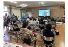
上山市東地区公民館