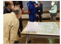
中山町防災研修会