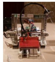
手作り 3Dプリンター (Arduinoを使用)